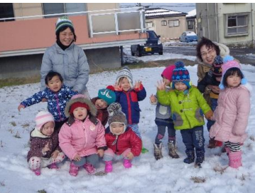
雪が降った日に保育園の周りの散歩を楽しみました♪

2月9日の園開放では、「大きな紙に絵を描こう」というテーマで、参加のお友達や保護者の方と一緒にぬり絵やお絵かきをしました。お家の形のぬり絵から「おばけの家にしよう！」とイメージを膨らませたり大好きな電車や車を描いたり、1人1人が大きな紙にのびのびと描くことを楽しみました。