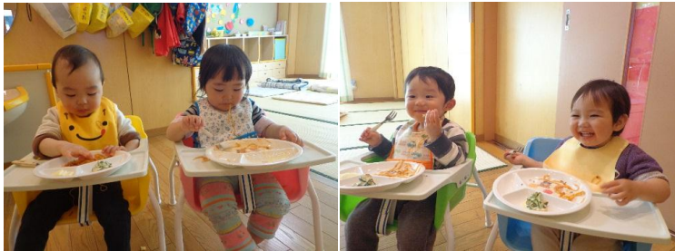
<ひよこ組:給食の様子>

ひよこ組の給食の様子です。この時間は一番楽しみにしていて、自分の所に給食が配られると、スプーンを上手に持って食べられるようになりました。毎日残さず完食できるようになり日々の成長を感じます。