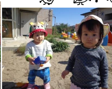
<ひよこ組：園庭で砂遊び>