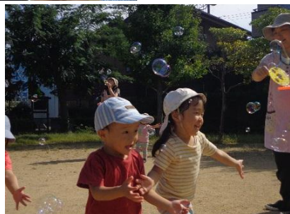
<きりん組：かけっこ>