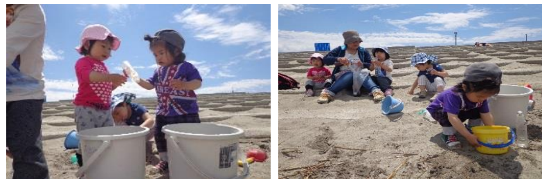
<うさぎ、きりん組:海>

さわやかな初夏の風に誘われてうさぎ組ときりん組 一緒に海へ行ってきました。砂浜でお茶を飲むと早 速遊び開始。バケツに汲んだ海水を容器に入れ、 ひたすら水遊び。誰も顔を上げてくれず笑顔なし でした。「また行こうね!」と言っていました。