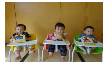
<ひよこ組:父の日プレゼント製作>

7月2日(日)の病院祭では、まさご保育園でもボーリング、わなげ、 うちわ製作、お菓子作り、お話を時間を設けます。 是非お越し下さい!!